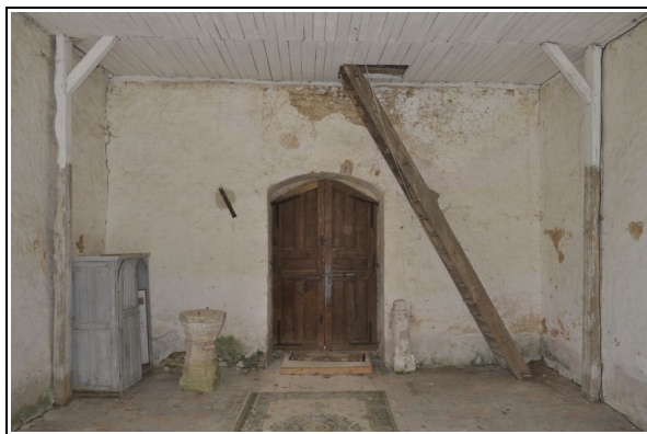
Vue du mur ouest avant restauration.