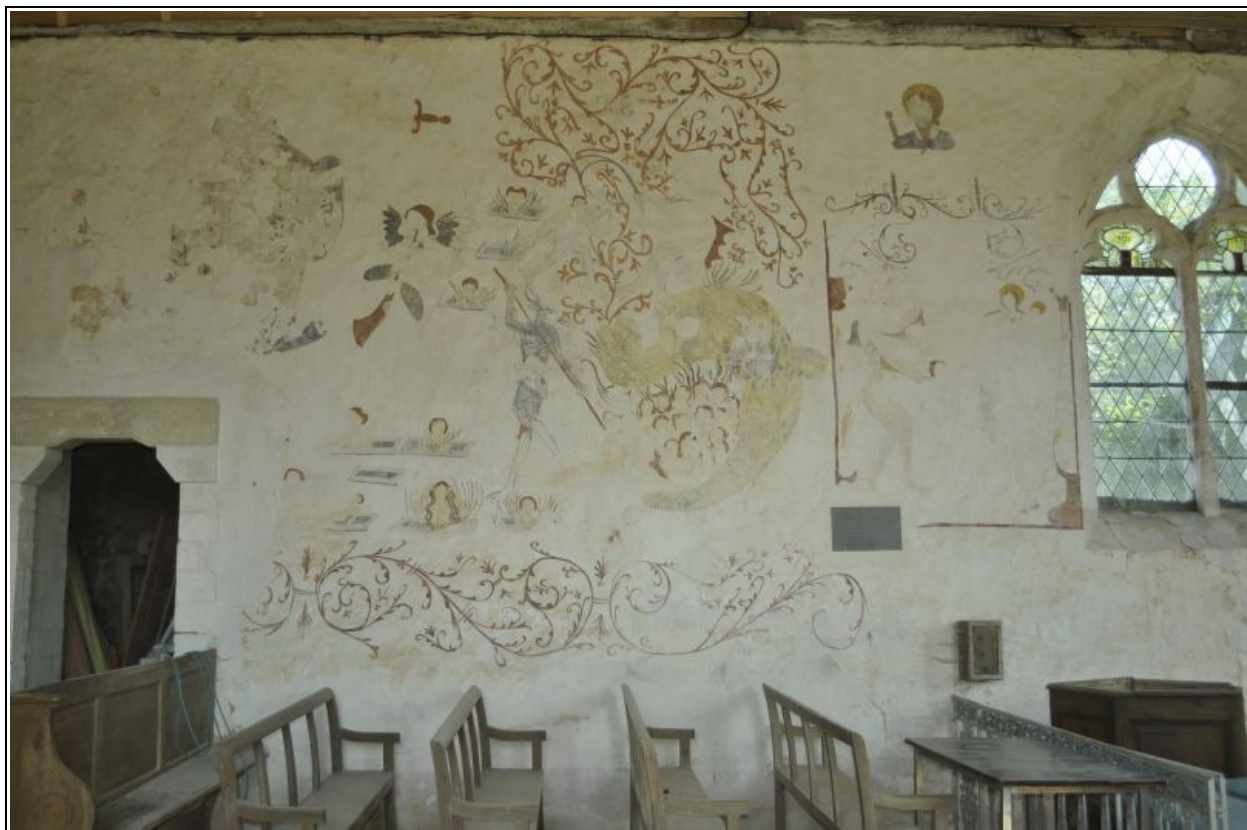
Mur nord après restauration.