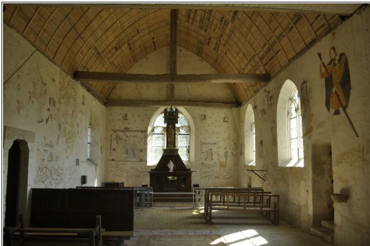
Vue de l'ensemble de l'église après restauration des peintures murales.