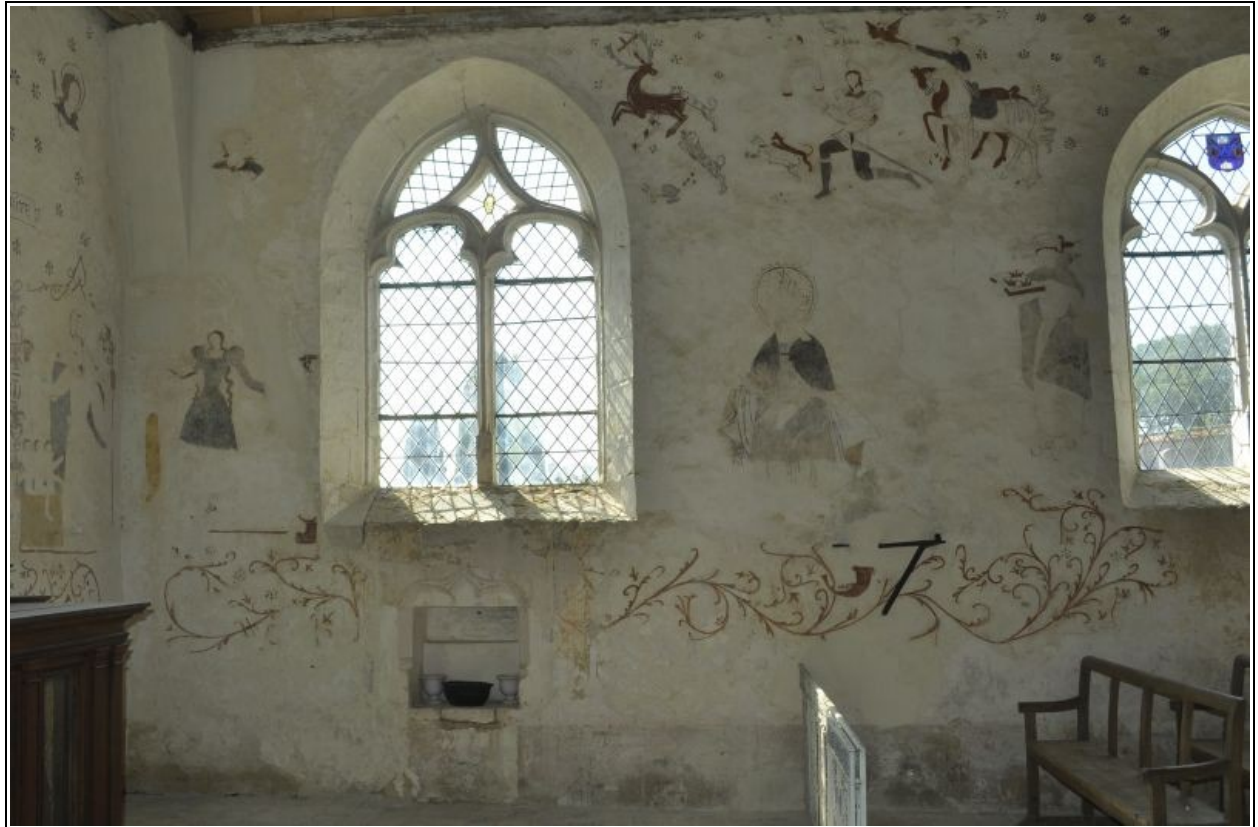
Mur sud après restauration