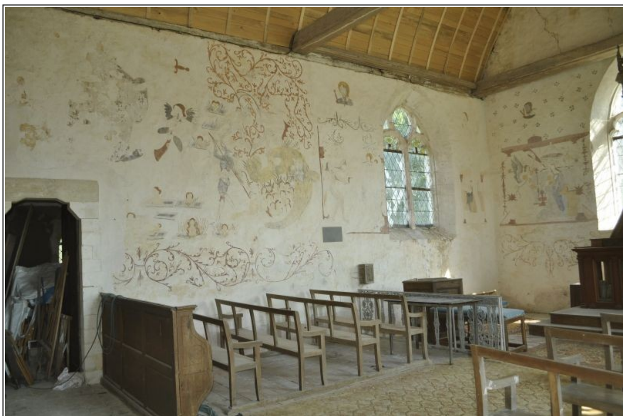
Vue de l'ensemble du mur nord après restauration des peintures murales.