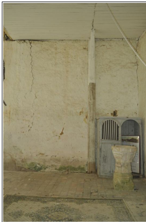
Vue de la partie occidentale du mur sud.