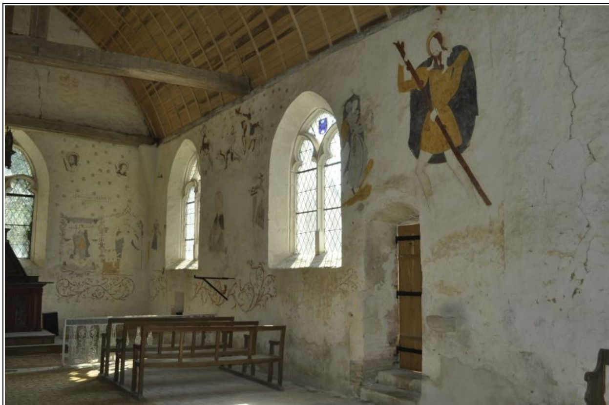
Vue de l'ensemble du mur sud après restauration des peintures murales.