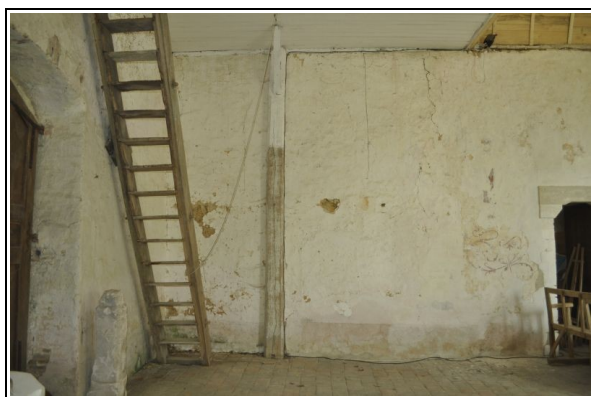
Vue de la partie occidentale du mur nord.